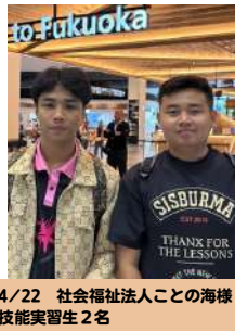
4/22 社会福祉法人ことの海様 技能実習生 2名