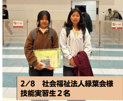
2/8 社会福祉法人緑葉会様 技能実習生 2名