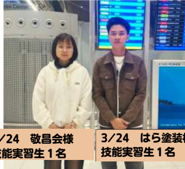
3/24 敬昌会様 技能実習生 1名