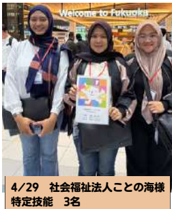
4/29 社会福祉法人ことの海様 特定技能 3名