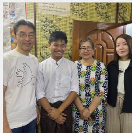
社会福祉法人夏吉睦福社会 男性介護人材1名の採用を決定。採用を 本人に直接伝えるシーンは心を打たれました。