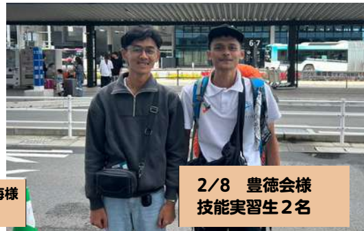
2/8 豊徳会様 技能実習生 2名