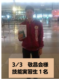
3/3 敬昌会様 技能実習生 1名