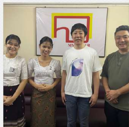
株式会社トラネス様 特定技能、技能実習、それぞれ1名ずつ 採用を決定。二次面接まで行いました。