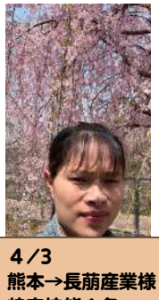
4/3 熊本→長萌産業様 特定技能 1名