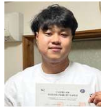
夏吉睦福社会 カウ ミヤツ ゾオさん 2025年12月合格

私が日本語を頑張ろうと思ったきっかけは、日本語の先生の言葉です。先生は「日本に行ったとき、先生に感謝したいならプレゼントをくれる必要はありません。勉強と仕事を一生懸命頑張って、しっかり生活してくれるが一番の恩返しです」と言ってくださいました。だから日本に来て1年以内にN2に合格するという目標を立て、12月のJLPT試験に向けて「絶対合格する」という気持ちで一生懸命勉強しました。私は特に漢字が苦手だったので、仕事をしながら日勤と夜勤の間でも毎日練習しました。その日に勉強した内容は、次の日の朝にもう一度しっかり復習してから新しい内容を勉強するようにしました。また、文法や読解は過去問題のアプリで練習し、聴解はYouTubeで毎日聞くようにし、日本語の先生のオンラインクラスの動画も何度も見て勉強しました。そのおかげで試験当日はあまり緊張せず、職場の応援もあり、無事にN2に合格することができました。これからも日本語の勉強を頑張りたいと思います。