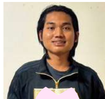
社会福祉法人十百千会 タッツ スイン ドゥーさん 2025年12月合格

私はN2に合格するために、教科書を勉強するより、職場の人利用者さんたちの会話をよく聞くようにしました。分からない言葉があれば、その場で分かるまで質問しました。また、漢字や単語を見つけた時はできるだけ読むようにして、分からない時はすぐに調べてメモしました。このように、毎日の生活の中で少しずつ勉強してきました。それがN2合格につながったと思います。