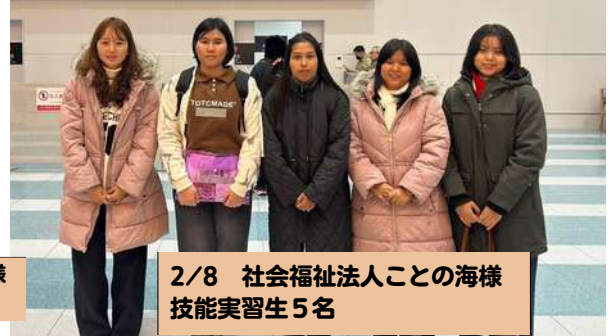
2/8 社会福祉法人ことの海様 技能実習生 5名