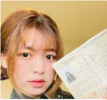
夏吉睦福祉会 ウェ タズイン ビョーさん 2025年7月合格

N2の平均合格率は30%台後半で、受験者の約3分の2が不合格になる難易度と言われています。その難しいテストに合格された方々に勉強法や努力したところを聞いてみました！