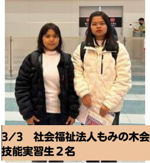
3/3 社会福祉法人もみの木会様 技能実習生 2名