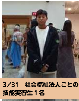
3/31 社会福祉法人ことの海様 技能実習生 1名